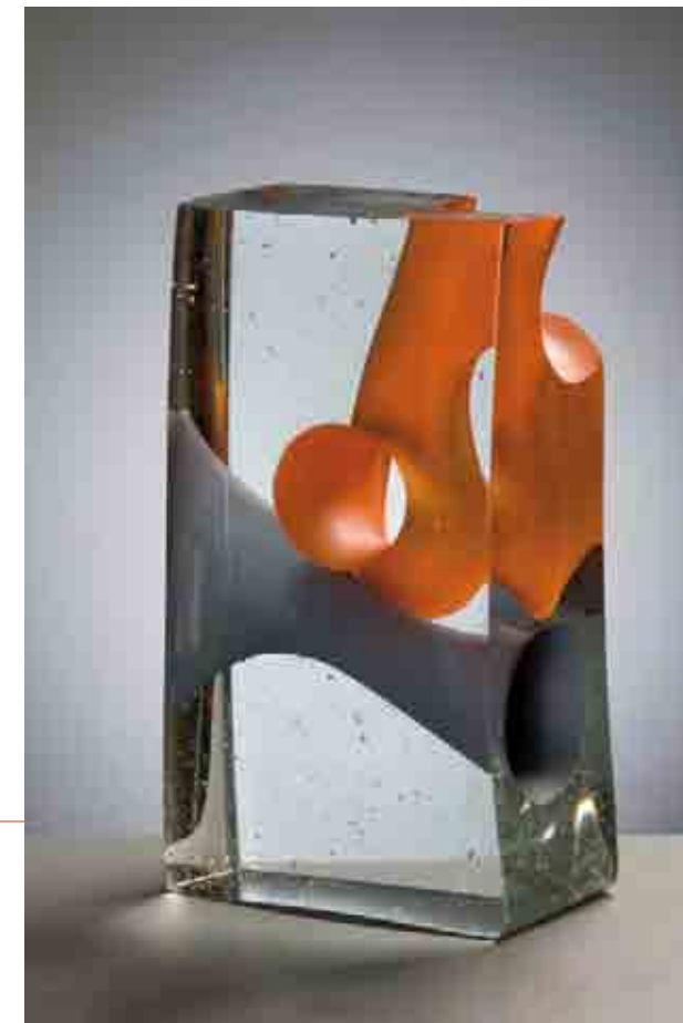
DE GOLFTIJD, 2010 Crystal glass, 27 cm hoog