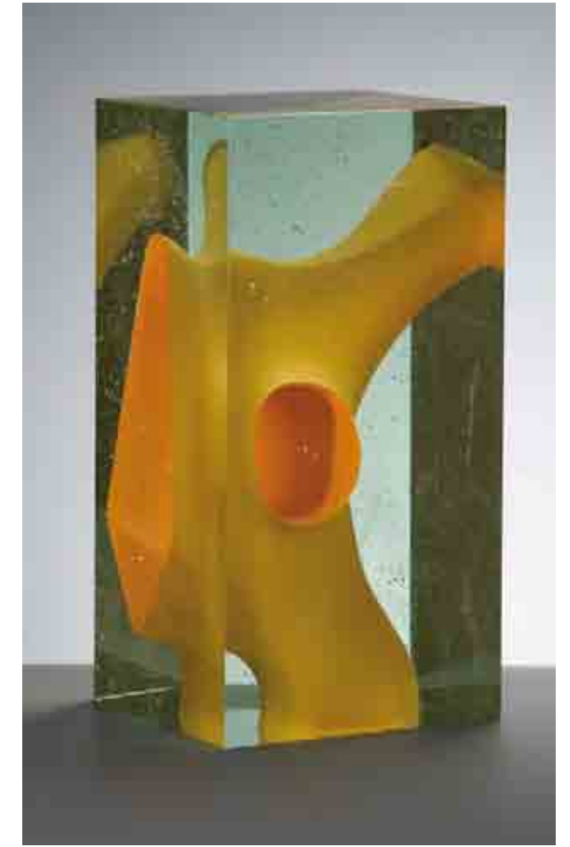
DE TIJDSTROOM, 2009 Crystal glass, 40 cm hoog