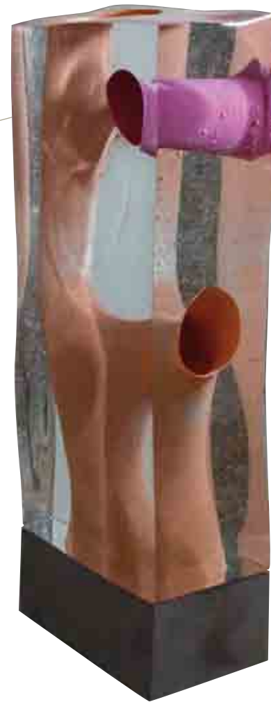
WEINIG MEELEVEN, 2010 Crystal glass on blue stone base, 120 cm hoog