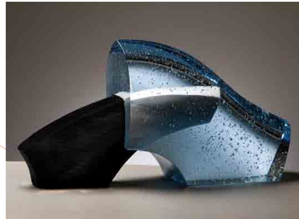
BERICHTEN UIT EEN VOORTIJD, 2010