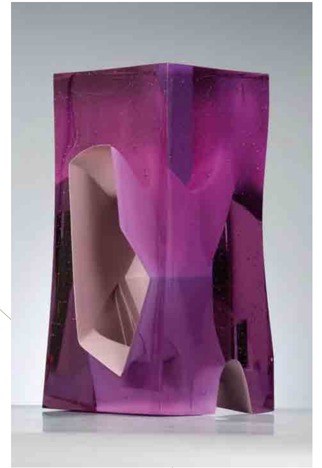
MESOCOSM I, 2010 Crystal glass, 27 cm hoog