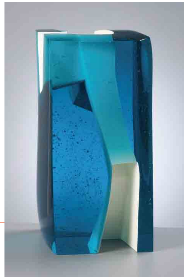
MESOCOSM II, 2010 Glass 403, 40 cm hoog

Het vertrekpunt bij het werken met glas is vaak diezelfde lichtbron. Deze geeft leven aan de raadselachtige kleurencombinaties van glas. Glasobjecten zijn tegelijkertijd ontvanger en zender van licht. De vormtaal van de objecten, met de suggestie van bewegingen in de vrije ruimte, voegt er een extra dimensie aan toe: de breking van het licht.