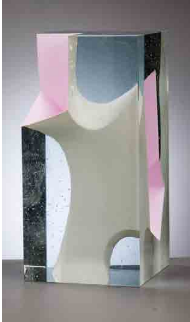
FATHOM, 2010 Crystal glass, 40 cm hoog