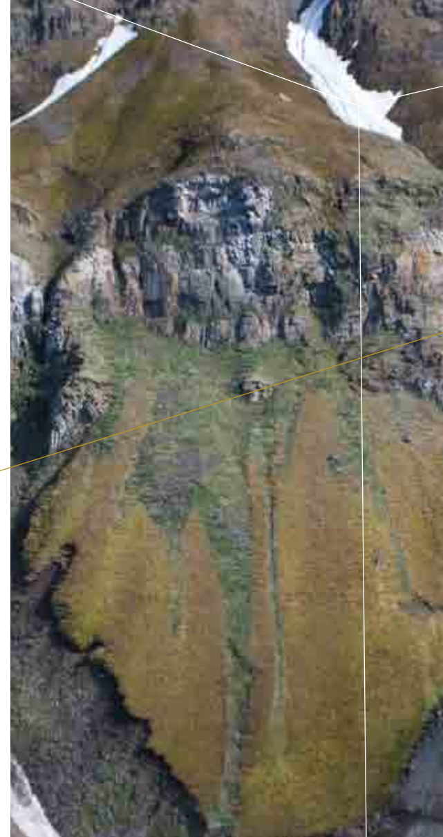
AMBER BESCHUT, 2010 Glass 211, 40 cm hoog

De Kluijvers Mesocosm(s) zijn een artistieke verbeelding van dat proces: het glas omsluit een kosmos van niet met het oog zichtbare gemeenschappen van organismen. Maar ook de grillige vormen en verrassend felle kleuren die het diepzeeleven voor ons verborgen houdt, komen in deze bijzondere objecten prachtig tot uiting.