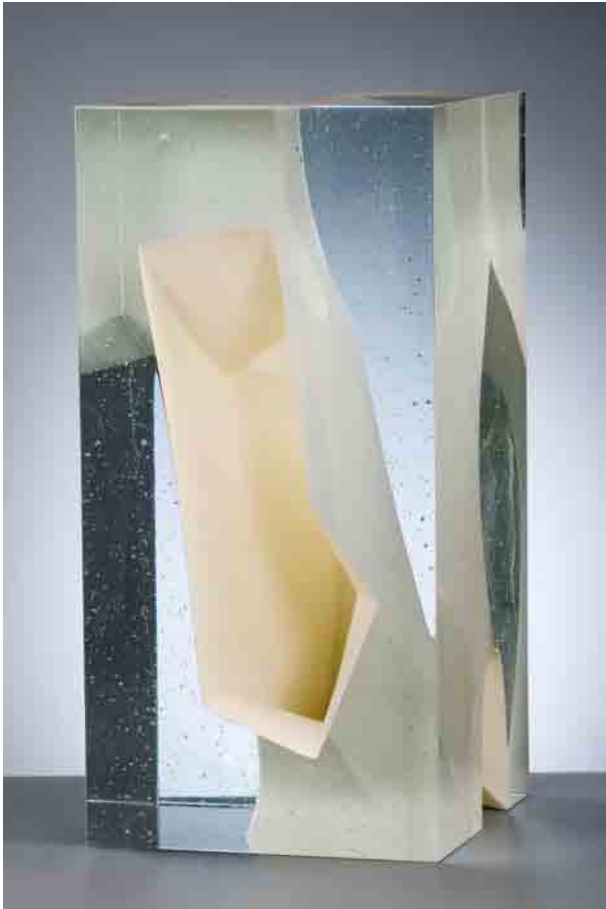
MESOCOSM IV, 2010 Crystal glass, 40 cm hoog