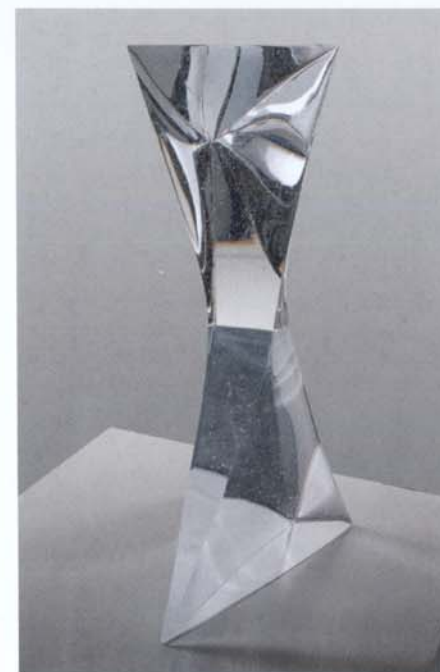
Han de Kluijver, De onzichtbare kracht , 2013; gegoten kristal; h 65 x 20 x 45 cm.